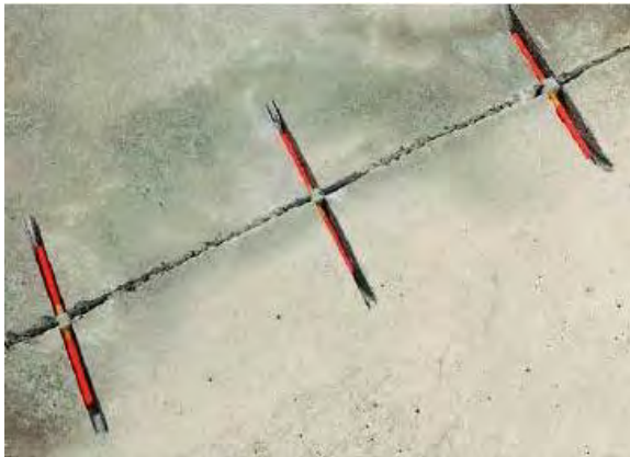
Рисунок 4. Установка стержней в каналы, открытые в трещинах

воздуха удалите пыль. Затем тщательно установите анкеры в каналы, рис.4.