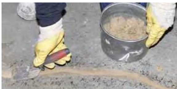
Рисунок 6. Выравнивание поверхности и трещин при помощи средства MasterInject /MasterFlow.

соответствующий эпоксидный состав из серии MasterBrace/MasterFlow для ее выравнивания. В случае отсутствия готового материала для герметизации на месте, приготовьте смесь, используя MasterInject 1360 и сухого чистого кварцевого песка и заполните штрабу этой смесью, рис.6.