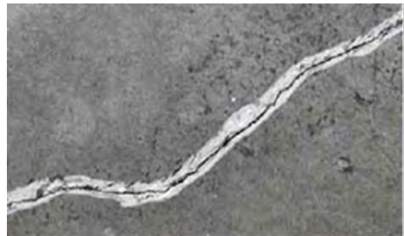
Рисунок 3. V-образная канавка вдоль трещины

В случае малой прочности бетона/ очень слабого подстилающего слоя, необходимо расширить трещину в форме V-образной канавки вдоль трещины, рис. 3.