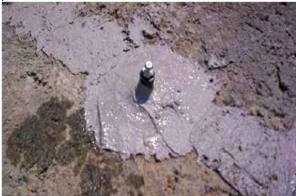
Рисунок 2. Герметизация пакера, установленного на поверхности и трещины при использовании соответствующего средства

Расположение пакеров необходимо определить перед установкой. В зависимости от размера трещины инъекционные пакеры необходимо установить на расстоянии 15 – 50 см друг от друга по всей длине трещины. Для закрепления пакера к бетону нанесите небольшое количество необходимого эпоксидного состава/ шпатлевки MasterBrace/MasterFlow вокруг основания пакера. Начинайте устанавливать пакеры с одного конца трещины и повторяйте эту операцию, пока трещина не будет пройдена вся. Необходимо тщательно нанести эпоксидную шпатлевку вокруг основания пакера, и закрыть саму трещину слоем состава не менее 3 мм. Герметизацию производить при помощи соответствующего эпоксидного состава/ шпатлевки MasterBrace / MasterFlow или используйте материалы MasterSeal 590/ MasterFlow 920 AN при необходимости проведения быстрых работ по инъектированию (через несколько часов после герметизации трещины и пакеров). Рекомендуется, чтобы уплотнение колпачка имело толщину не менее 3 мм и ширину 6-8 см при использовании материалов на эпоксидной основе, при использовании средства Masterseal 590 толщина должна быть более 10 мм. рис. 2.