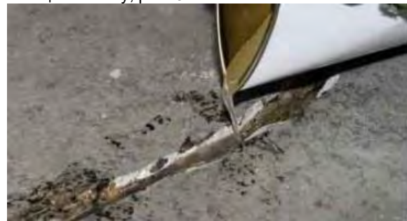
Рисунок 5. Заливка MasterInject 1360 непосредственно в V-образную штрабу на трещине

Начинайте нанесение сразу, как только материал будет готов после надлежащего смешения. Это – обязательное условие для обеспечения возможности более длительного времени жизни с целью обеспечения лучшего проникновения. Залейте смешанный состав MasterInject 1360 в V-образную штрабу на месте трещины. Дайте смоле проникнуть в трещину и продолжайте заполнять трещины до тех пор, пока они больше не смогут вмещать смолу, рис. 5.